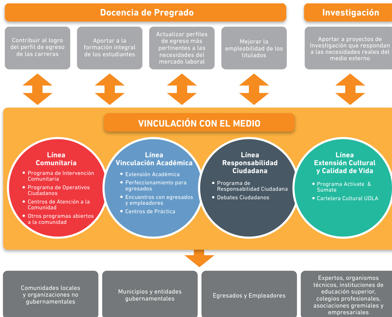
Figura 1: Modelo de Vinculación con el Medio UDLA

Este modelo, establece que los objetivos de Vinculación con el Medio deben contribuir a las otras funciones de la universidad, por medio del desarrollo de programas y acciones que forman parte de las líneas de VcM, así como también precisa los diferentes grupos de interés con los que la institución se relacionará para estos efectos.