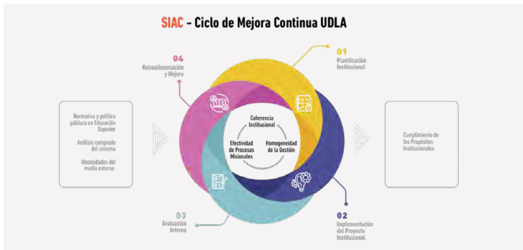
Figura 3. Sistema Interno de Aseguramiento de la Calidad