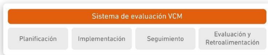
FIGURA 3. PROCESOS SISTEMA INTERNO DE ASEGURAMIENTO DE LA CALIDAD SIAC – UDLA VcM