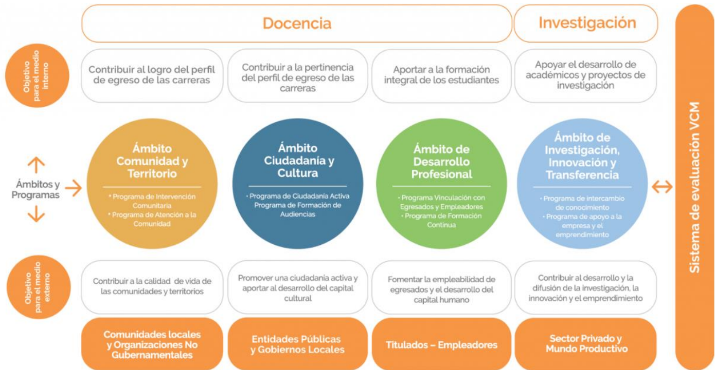
FIGURA 2. MODELO INSTITUCIONAL DE VINCULACIÓN CON EL MEDIO