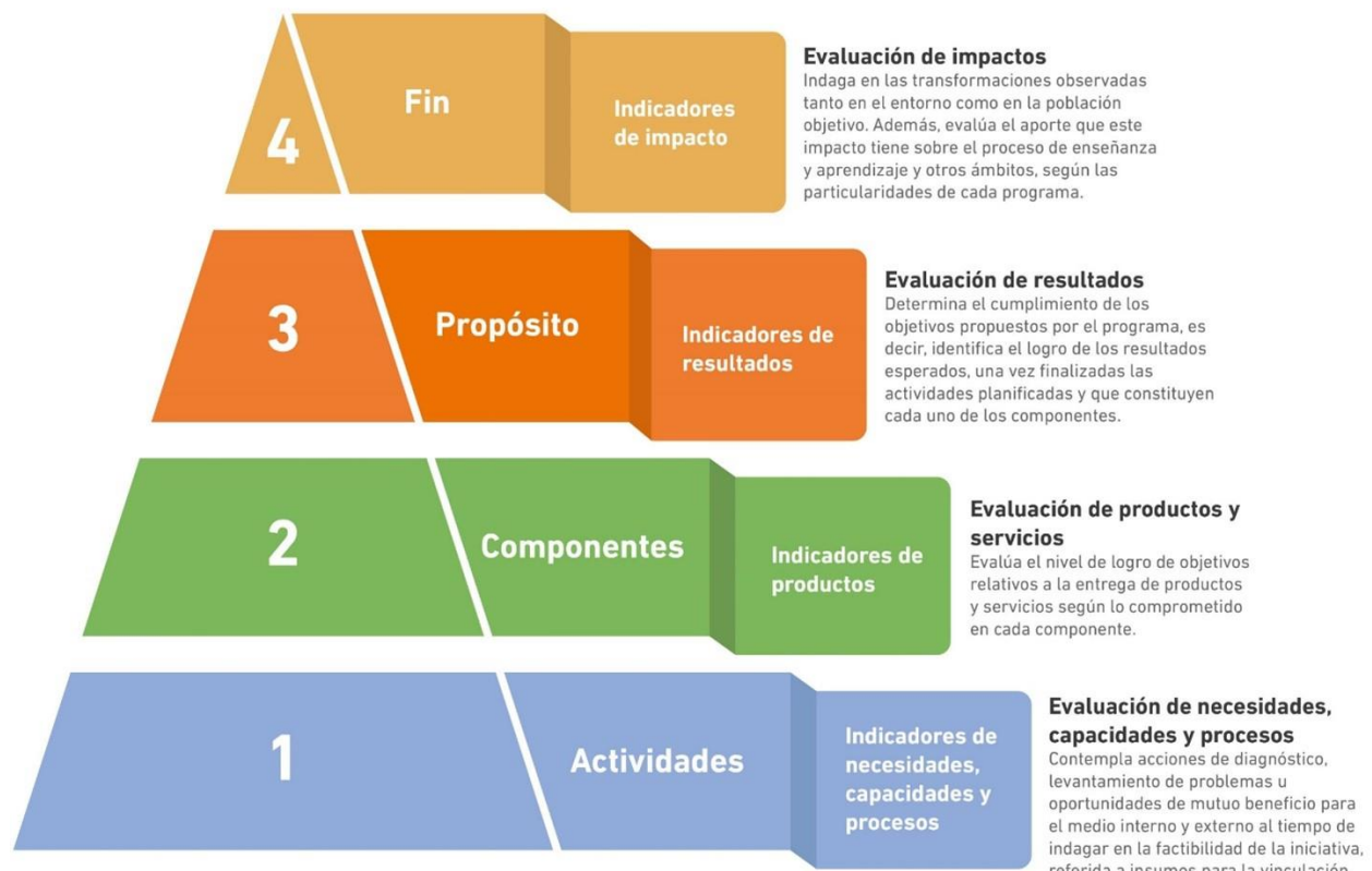
Figura 4: PIRÁMIDE DE EVALUACIÓN DE PROGRAMAS (PEP) DE VINCULACIÓN CON EL MEDIO EN UDLA