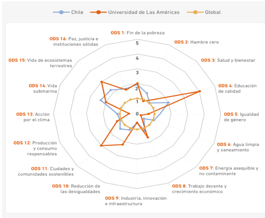
Gráfico 2: Investigaciones UDLA que tributan a cada ODS 2018-2022

Fuente: Vicerrectoría de Investigación sobre la base Scival Elsevier